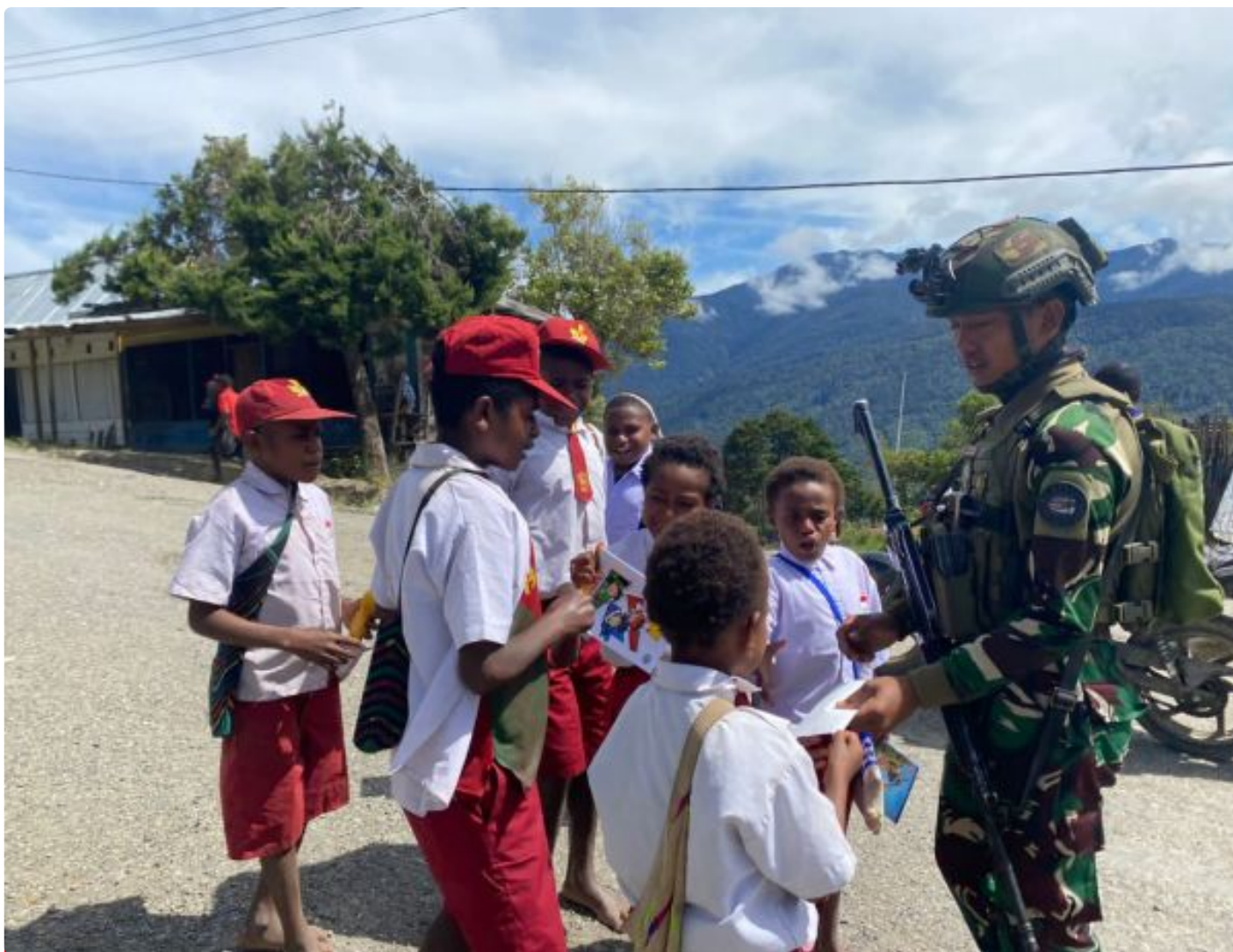
Foto: Satgas Yonif 509 Kostrad dari Titik Kuat (TK) J2 Melaksanakan Patroli Peduli Pendidikan di Intan Jaya Papua, Selasa (10/09/2024).

INTAN JAYA- Satgas Yonif 509 Kostrad dari Titik Kuat (TK) J2 kembali menunjukkan komitmen mereka dalam menciptakan keamanan serta kesejahteraan masyarakat Papua, khususnya anak-anak di daerah Intan Jaya,