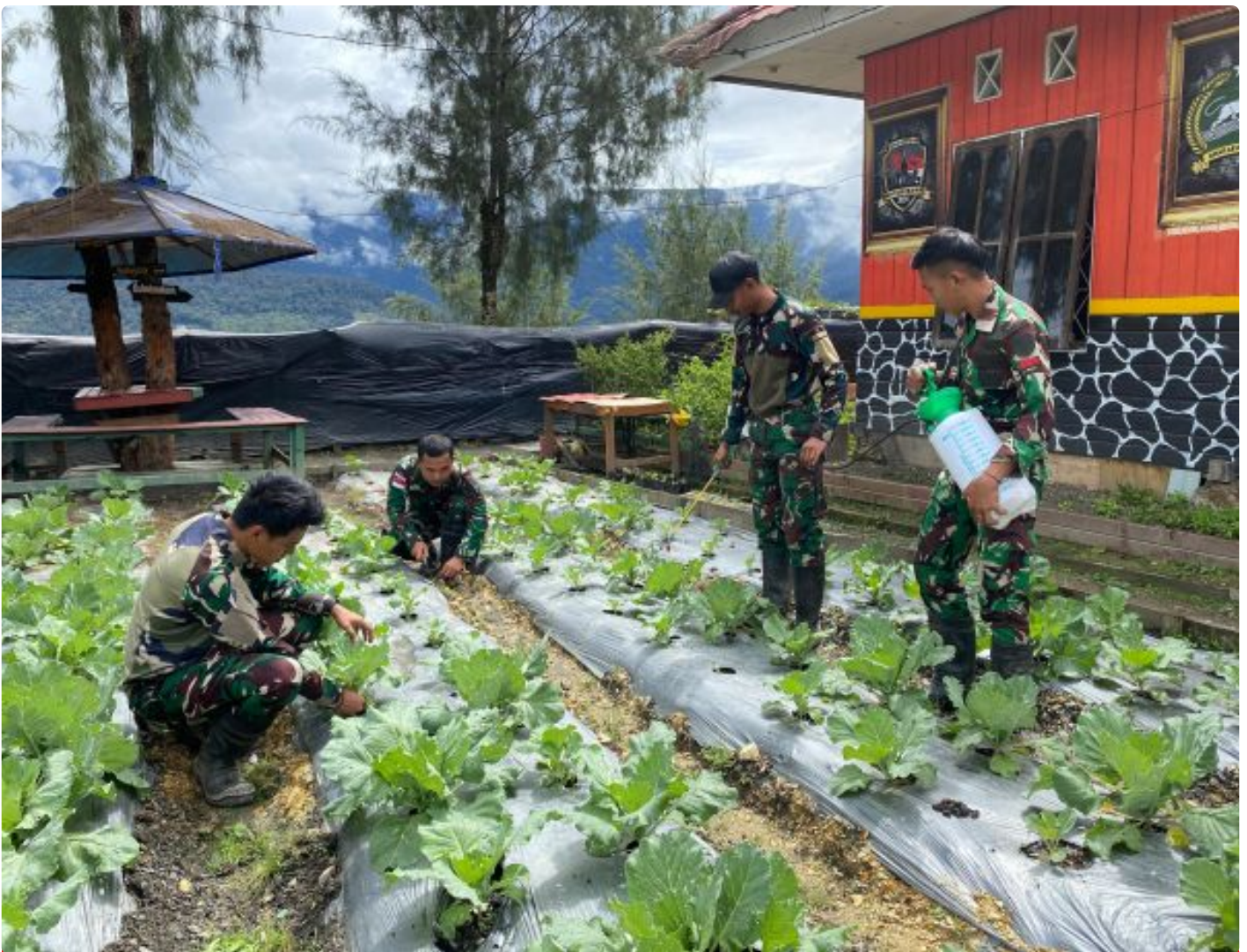
Foto: Satgas Yonif 509 Kostrad Melaksanakan Program Penanaman Sayur-mayur di Dalam Pos Intan Jaya, Papua. Kamis (11/07/2024).

INTAN JAYA- Dalam upaya mendukung ketahanan pangan di wilayah tugas, Satgas Yonif 509 Kostrad melaksanakan program penanaman sayur-mayur di dalam pos mereka. Kegiatan itu tidak hanya bertujuan untuk memenuhi