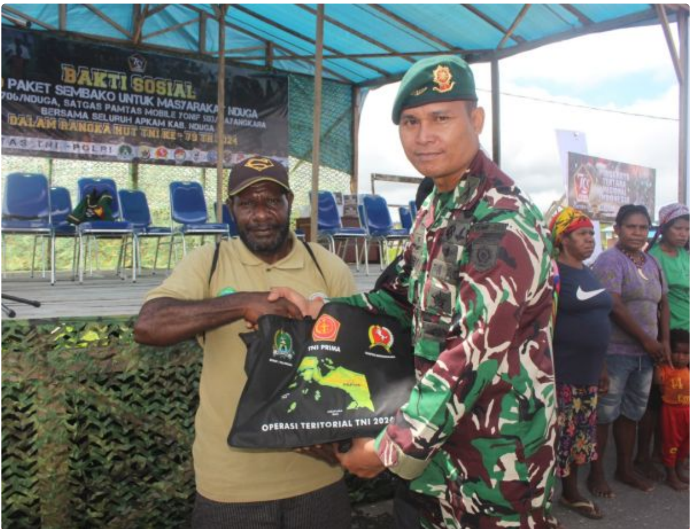
Foto: Satgas Pamtas Mobile RI-PNG Yonif 503/Mayangkara Koops Habema bersama seluruh aparat keamanan (Apkam) Kabupaten Nduga Bagikan 1000 Paket Sembako Dalam rangka HUT TNI Ke - 79, yang Dilaksanakan Secara Bertahap di Kota Kenyam Kabupaten Nduga Papua. Jumat (04/10/2024).