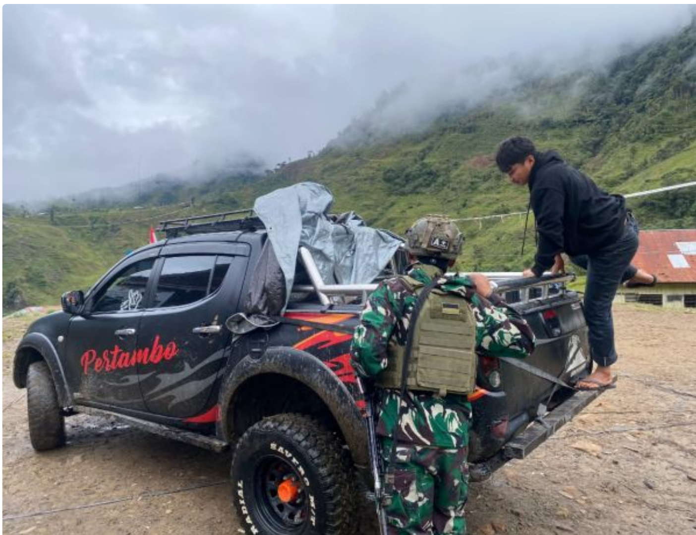
Foto: Saat Prajurit Satgas Yonif Para Raider 432/Waspada Setia Jaya Kostrad Satuan Jajaran Komando Operasi TNI (KOOPS TNI) HABEMA Melaksanakan tugas Operasi Pengamanan Perbatasan (Opस्पamtas) Mobil RI-PNG, di Wilayah Kabupaten Nduga, Provinsi Papua Pegunungan, Minggu, 30 Juni 2024.

MBUA- Satuan Tugas Batalyon Infanteri (Satgas Yonif) Para Raider 432/Waspada Setia Jaya Kostrad, salah satu Satuan Jajaran Komando Operasi TNI (KOOPS TNI) HABEMA, tengah melaksanakan tugas Operasi Pengamanan Perbatasan (Opस्पamtas) Mobil RI-PNG, khususnya di wilayah Kabupaten