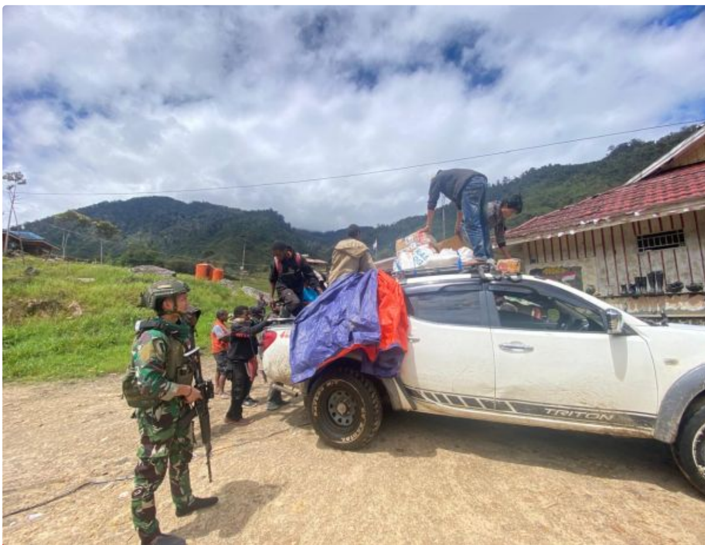
Foto: Prajurit Lintas Udara 432 /WSJ Melaksanakan Sweeping Kendaraan Dalam Rangka Menghambat gerak OPM yang Melakukan Aksi Gangguan di Distrik Mbua, Kabupaten Nduga, Papua Pegunungan, Senin (29/07/2024).

NDUGA- Prajurit Lintas Udara 432 /WSJ melaksanakan Sweeping kendaraan dalam rangka menghambat gerak OPM yang melakukan aksi gangguan di Distrik Mbua, Kabupaten Nduga, Papua Pegunungan, Senin (29/07/2024).