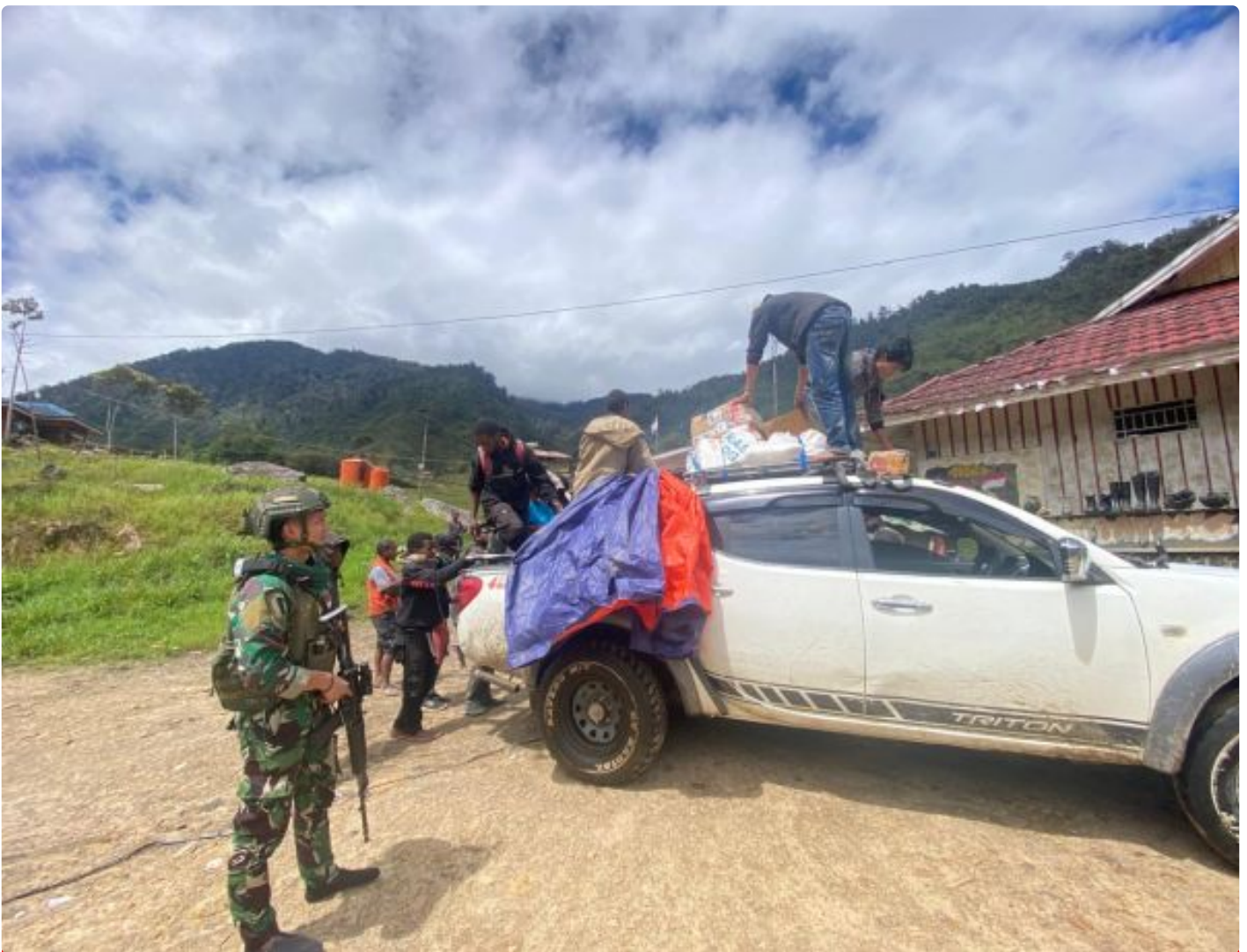
Foto: Prajurit Lintas Udara 432 /WSJ Melaksanakan Sweeping Kendaraan Dalam Rangka Menghambat gerak OPM yang Melakukan Aksi Gangguan di Distrik Mbua, Kabupaten Nduga, Papua Pegunungan, Senin (29/07/2024).

NDUGA- Prajurit Lintas Udara 432 /WSJ melaksanakan Sweeping kendaraan dalam rangka menghambat gerak OPM yang melakukan aksi gangguan di Distrik Mbua, Kabupaten Nduga, Papua Pegunungan, Senin (29/07/2024).