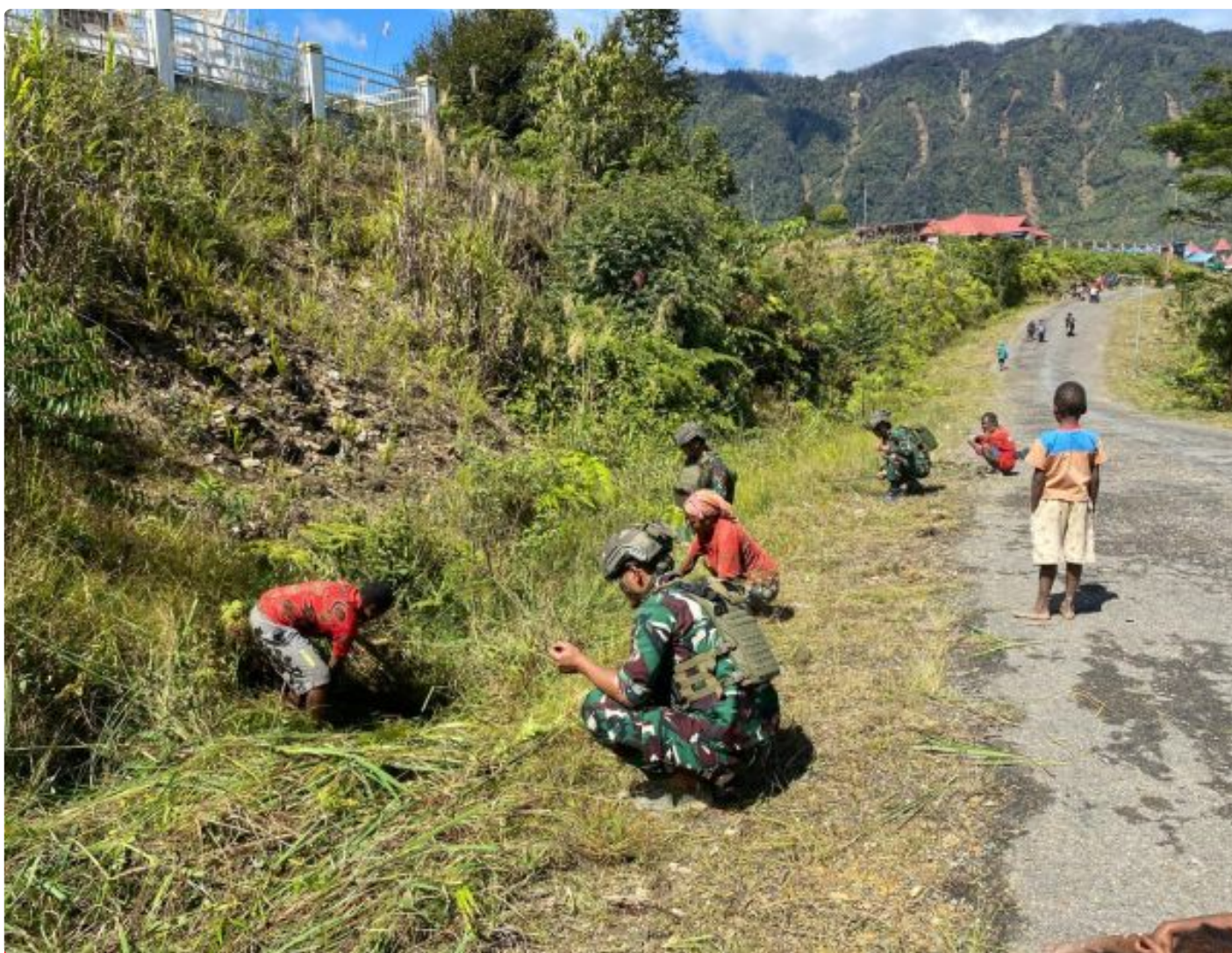
Foto: Satgas Yonif 509 Kostrad Bersama Warga Masyarakat Kampung Mamba Menggelar Kerja Bakti Membersihkan Lingkungan di Kampung Mamba, Intan Jaya, Papua, Senin (5/7/2024).

INTAN JAYA- Menjelang peringatan Hari Kemerdekaan Republik Indonesia yang ke-79, Satgas Yonif 509 Kostrad bersama warga masyarakat Kampung Mamba menggelar kerja bakti membersihkan lingkungan di Kampung Mamba, Intan