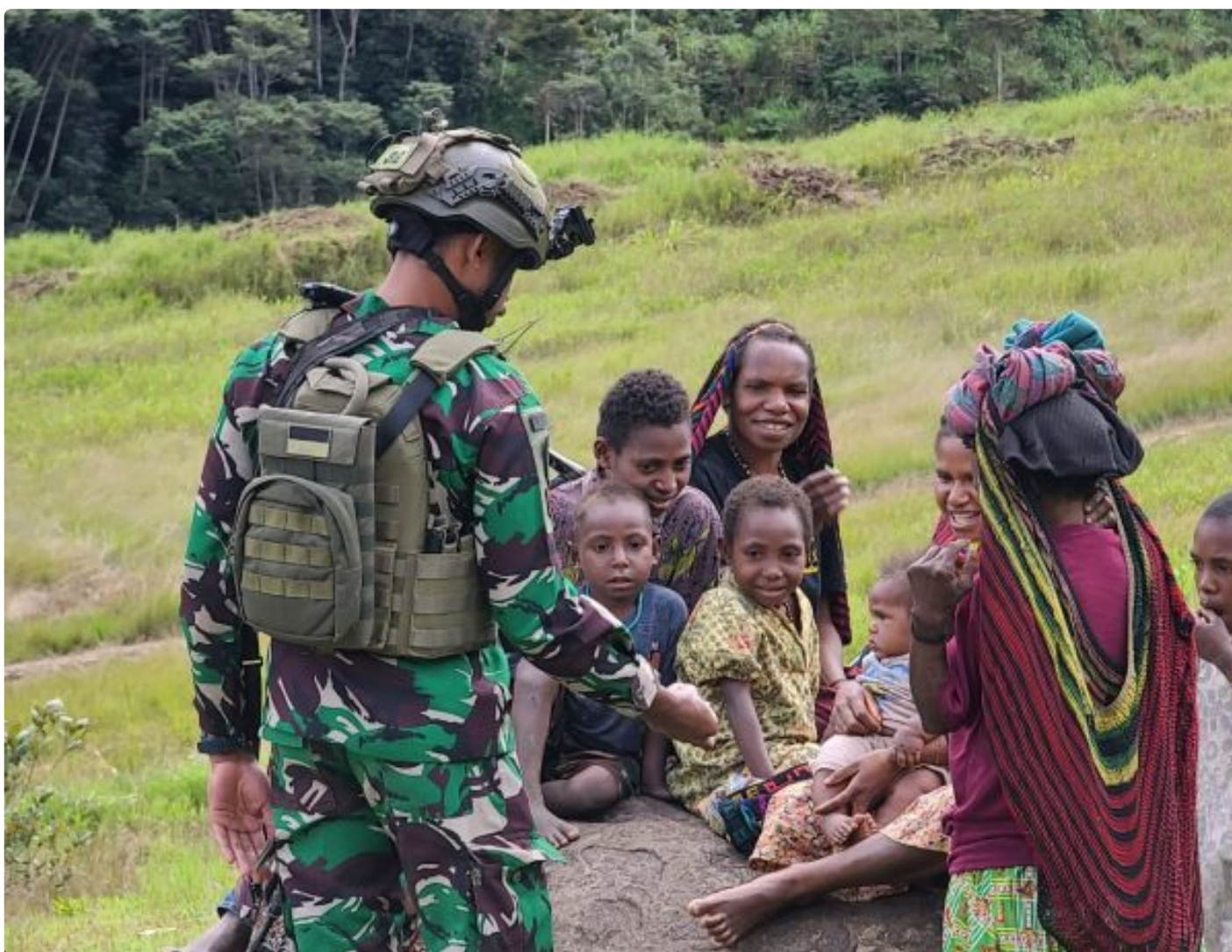
Foto: Prajurit Lintas Udara 432 Menberikan Wawasan Kebangsaan dan Juga Membawa Kesan Baik Kepada Seluruh Anak-anak Khususnya di Distrik Mbua, Kabupaten Nduga, Papua Pegunungan, Senin (24/06/2024).

NDUGA- Generasi Emas Papua tulang punggung bangsa Indonesia dan Rakyat Papua Menuju Indonesia Emas, Distrik Mbua, Kabupaten Nduga, Papua Pegunungan, Senin (24/06/2024).