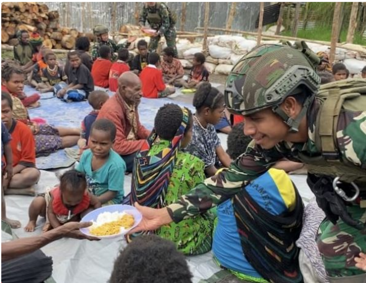
Foto: Saat Prajurit Lintas Udara 432/WSJ Melaksanakan Kegiatan Makan Siang Gratis Bagi Masyarakat Distrik Yigi, Kabupaten Nduga, Papua Pegunungan, Selasa (08/07/2024).

NDUGA- Prajurit Lintas Udara 432/WSJ melaksanakan Kegiatan makan siang