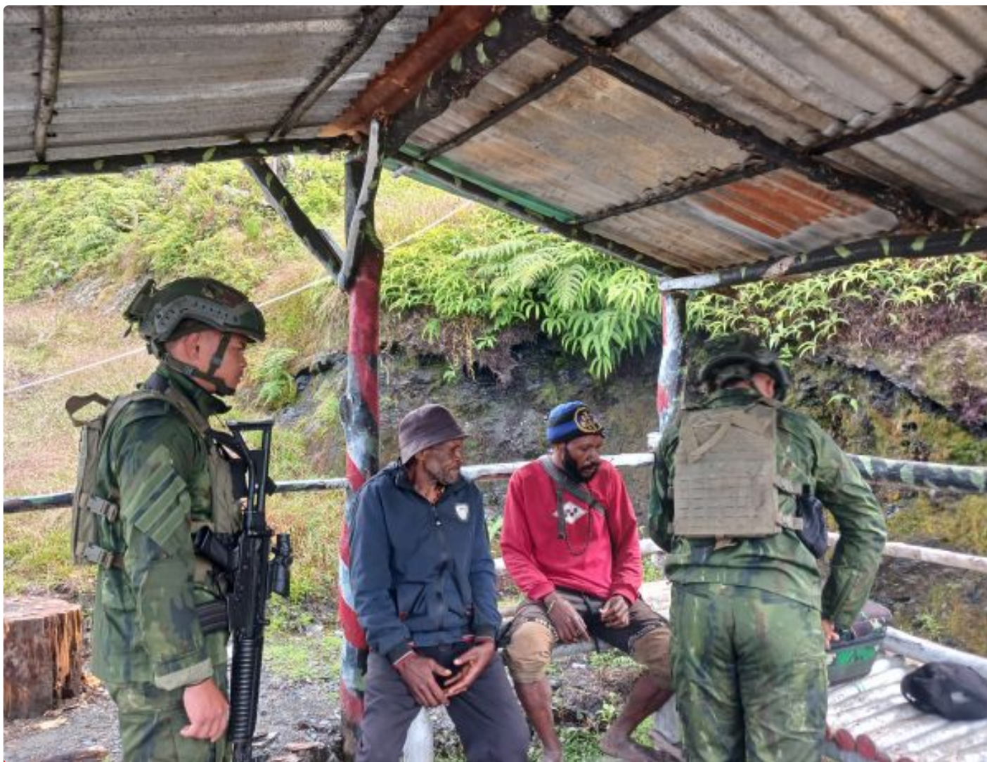
Foto: Pos Langit Satgas Yonif 509 Kostrad Menyediakan Nasi Bungkus Gratis dan Snack Setiap Harinya Bagi Warga Yang Melintasi Pos, Sabtu (20/07/2024).

INTAN JAYA- Pos Langit Satgas Yonif 509 Kostrad menunjukkan komitmennya